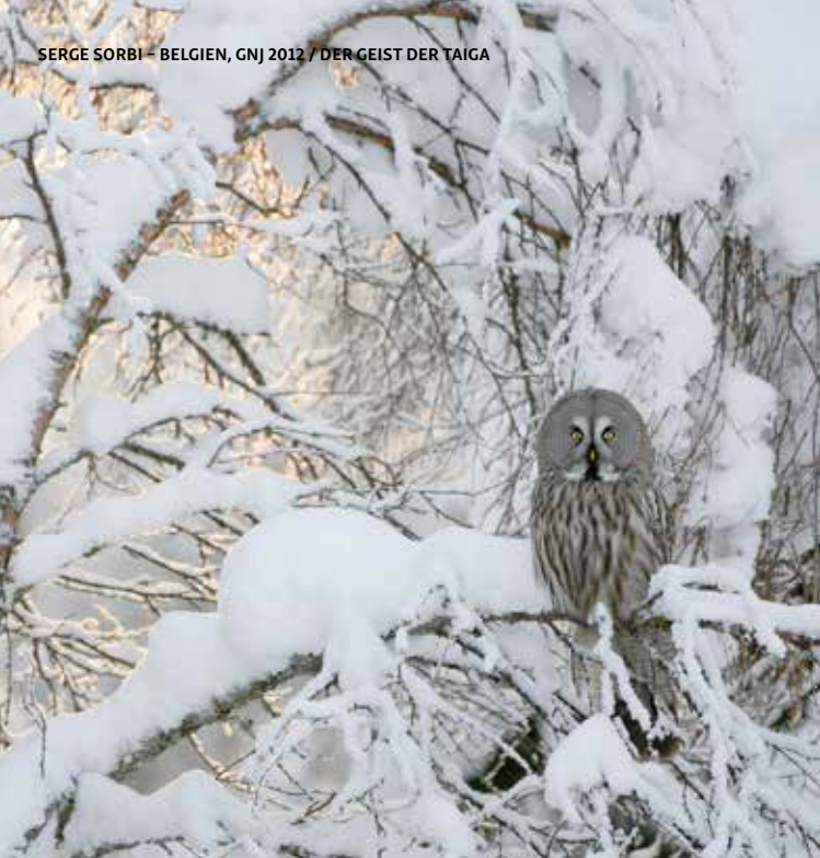
SERGE SORBI - BELGIEN, GNJ 2012 / DER GEIST DER TAIGA