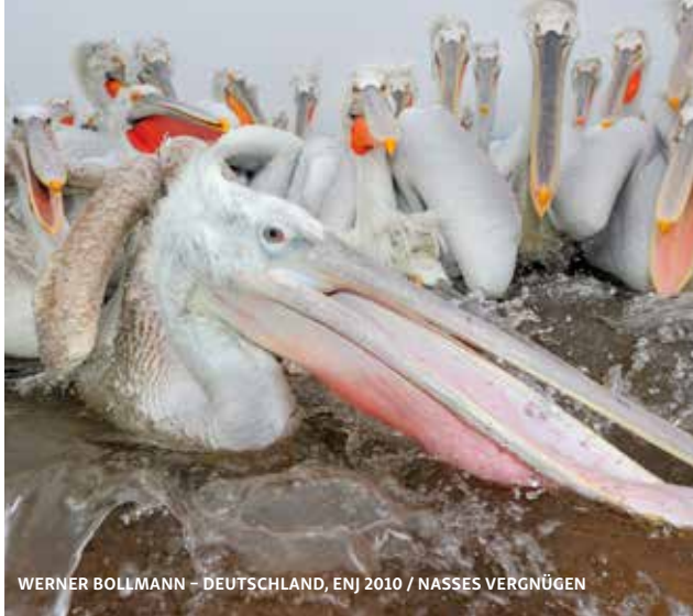
WERNER BOLLMANN – DEUTSCHLAND, ENJ 2010 / NASSES VERGNÜGEN