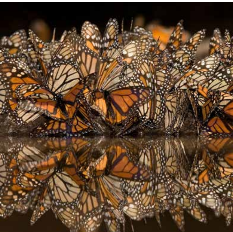
INGO ARNDT - DEUTSCHLAND, ENJ 2008 / TRINKENDE MONARCHFALTER