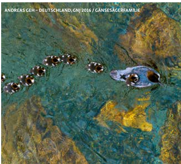
ANDREAS GEH – DEUTSCHLAND, GNJ 2016 / GÄNSESÄGERFAMILIE

Die GDT steht für eine Naturfotografie mit Respekt und Authentizität. Ihre Mitglieder verpflichten sich hohen ethischen Standards, verzichten auf digitale Manipulationen und legen Wert auf einen nachhaltigen Umgang mit der Natur. Die ausgestellten Fotografien spiegeln diesen Anspruch wider und laden dazu ein, unsere Umwelt aus einer neuen Perspektive zu betrachten.